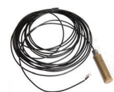
CPS PLUS Sistema a cavo microfonico

Il sistema può avere una copertura massima di 400m e zone da massimo 50m e può utilizzare sia il cavo microfonico che sensori piezoelettrici.