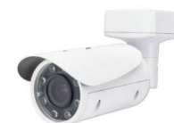
Telecamera con analisi video