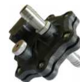
Sensore GPS in polimeri di fibra di carbonio